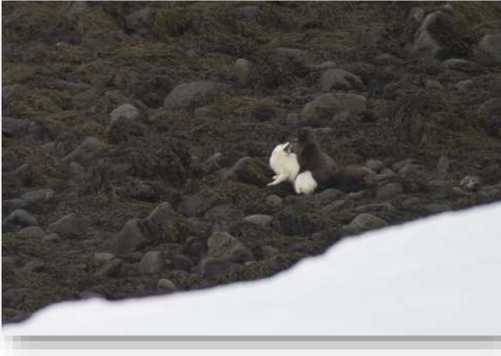
Mynd 6. Refir að Kvíum á þörunartíma. Dýrin gera ekki upp á milli og mórauðir parast oft með hvítum.

Í tvær vikur í febrúar og mars var að þessu sinni farið í jökulfirðina og fylgst með fæðuöflun, þörun og hugsanlegri óðalsmyndun dýra að Kvíum, milli Veiðileysufjarðar og Lónafjarðar.