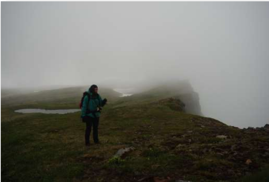
Mynd 10. Á Hælavíkurbjargi um hábjartan dag á miðju sumri. Ekki beinlínis sumarlegt á að líta.

Sumarið var ansi votviðrasamt og kalt, til dæmis gerði slyddu í miðjum júlí og var lofthiti um 4°C um vikubil. Þó tófan sé gerð til að lifa af fimbulkulda heimskautavetrarins er sumarfeldurinn ansi rýr auk þess sem yrðlingar hafa ekki burði til að halda á sér hita fáir þeir ekki nægilegt æti. Hugsanlega gæti verið þarna einhver sjúkdómur eða sníkjudýr sem veldur því að fleiri yrðlingar drepast en annars staðar, þetta þarf að athuga nánar og því er frekari vöktun gríðarlega mikilvæg. Töluvert safnaðist af refaskít en hann mun síðar verða greindur til að leita eftir streituhormónum og fleiru sem gæti varpað ljósi á heilsufar dýranna á svæðinu. Hornbjargið er eitt þéttasta refasvæði landsins og gæti þess vegna verið útsettara fyrir smitandi sjúkdómum og sníkjudýrum sem hafa neikvæð áhrif á afkomu dýranna. Þetta á væntanlega eftir að skýrast frekar á komandi árum. Áhugavert væri einnig að setja upp sjálfvirkar myndavélar til að fylgjast með afkomu yrðlinganna meðan ekki er rannsóknafólk á svæðinu.