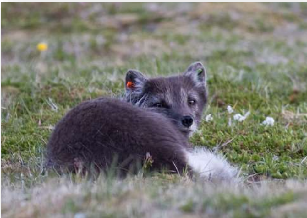
Mynd 2. Eyrnamerktur refur í Hornbjargi.