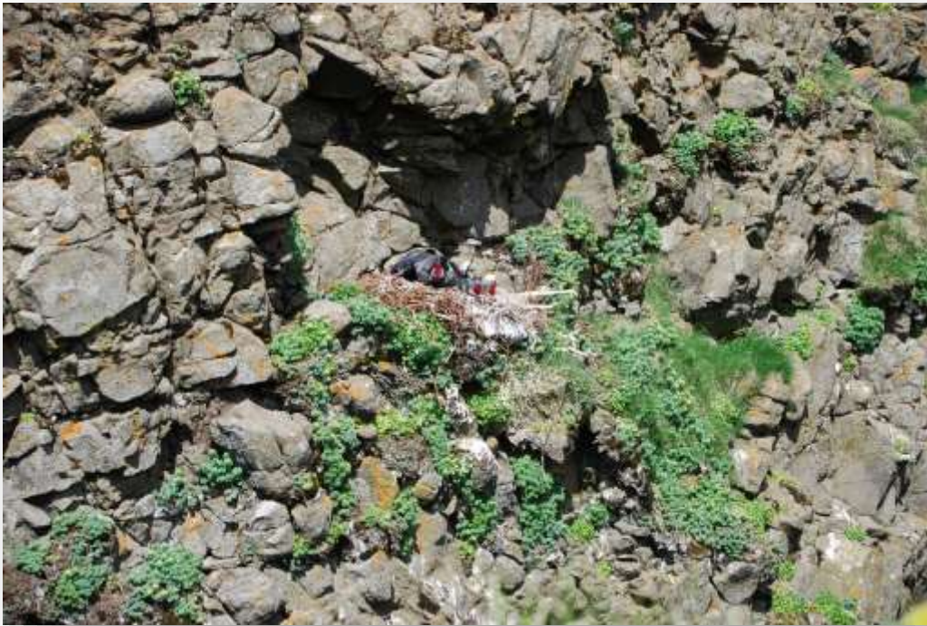
Mynd 8. Hrafnshreiður með 5 ungum í Hornbjargi í júní 2016.

bæði fugla, seli og refi. Sem betur fer höfðu þessir veiðipjófar ekki náð grendýrunum í Hornbjargi og að Höfn en hugsanlega karldýrinu í Rekavík bak Höfn.