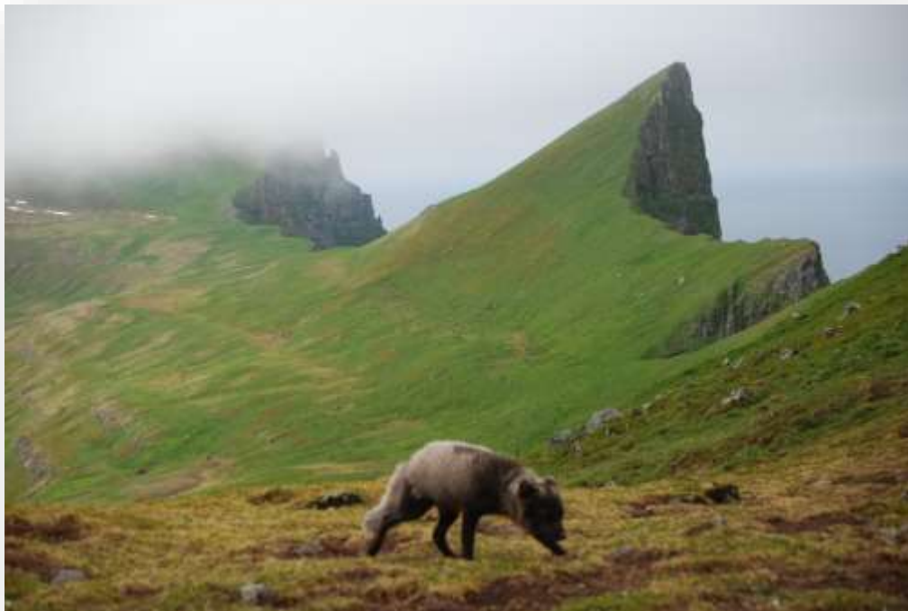
Mynd 11. Spakur óðalsrefur á Hornbjargi. Þessi átti fimm yrðlinga og gott óðal.

Vegna friðunar refa á Hornströndum hefur skapast mikil og oft á tíðum ómálefnaleg umræða, byggð á vanþekkingu og upphrópunum. Mikilvægt er að nýta sem best þau tækifæri sem fást til að safna rannsóknagögnum á svæðinu og vanda til við úrvinnslu þeirra. Margt bendir til þess að refirnir á Hornströndum hafi nokkra sérstöðu hvað varðar þéttleika og félagskerfi. Í austanverðri Hornvík hefur t.d. verið fylgst afar náið með allt að 6-7 óðalspörum um nokkurt skeið. Komið hefur í ljós ýmislegt markvert sem vakið hefur athygli erlendra fræðimanna, svo sem mikil þolinmæði gagnvart nágrönnum (e. tolerance) sem bendir til náns skyldleika dýranna. Einnig er athyglisvert að skoða hversu há dánartíðni yrðlinga virðist vera þar sem þéttleikinn er mestur. Síðastliðið sumar hefur borið á útvíkkun óðala og breytingu á landamærum. Þetta ásamt fleiru þarf að skoða áfram til að skilja hvað veldur en grunur beinist að breytingum í fæðuframboði sem getur bent til ástandsbreytinga hjá bjargfugli. Vegna mikils þéttleika refa og þess hve svæðið er í rauninn smátt er tiltölulega auðvelt að vakta svæðið, að minnsta kosti í samanburði við önnur útbreiðslusvæði tegundarinnar, túndrur og fjallahéruð norðurljarans. Því geta rannsóknir okkar á Hornströndum orðið til þess að auka þekkingu á líffræði og félagskerfi þessa rándýrs sem einkennir vistkerfi norður heimskautsins.