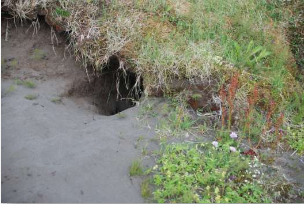
Mynd 9. Nýtt greni í sandbakka í Hlöðuvík. Þetta er ekki byggt til að endast til frambúðar.

Í Hlöðuvík þurfti að leita óvenju lengi að grendýrum því hin hefðbundnu greni voru ekki í ábúð. Í ljós kom nýtt greni sem grafið hafði verið út í sendinn sjávarbakka. Þar sást til spakra dýra með yrðlinga frameftir sumri en svæðið var ekki athugað síðsumars. Oft eru tvö pör í Hlöðuvík en sl. sumar var einungis þetta par með yrðlinga í vikinni.