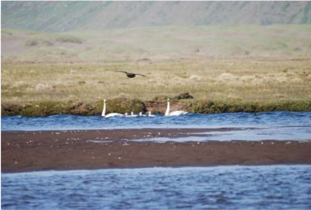
Mynd 13. Skúmur flýgur yfir álftapar með unga í Hornvíkurósi.