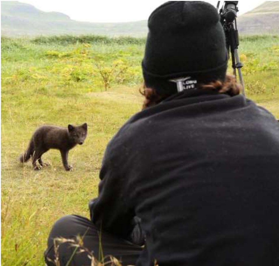
Mynd 4. Ferðamaður ljósmyndar ungan ref í Hornvík.

Alþjóðlegur hópur vísindamanna sem rannsakar heimskautarefinn hefur undanfarið unnið að samræmingu á aðferðum við mælingar og skráningar á vettvangi. Er þetta afar mikilvægt til að hægt sé að bera saman þætti sem skipta máli fyrir vistfræði tegundarinnar á ólíkum svæðum. Undirrituð er virkur þátttakandi í þessu verkefni enda mikilvægt að athuganir hérlendis séu unnar með vísindalegum