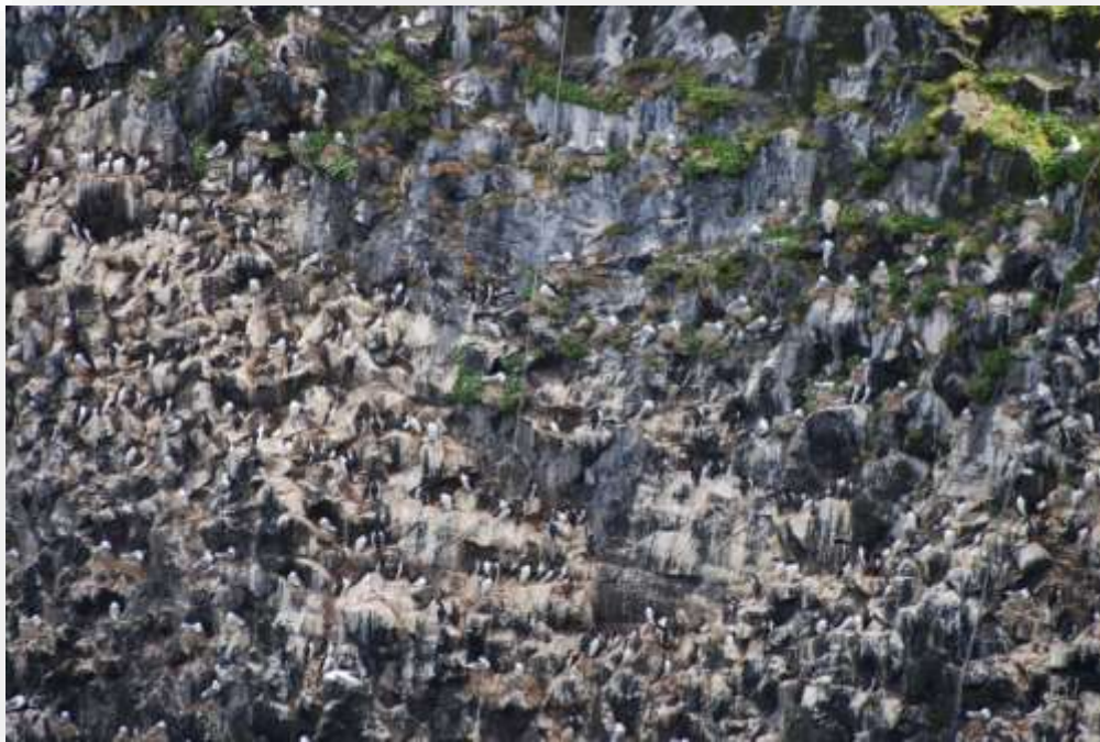
Mynd 12. Nóg er enn af bjargfugli í Horn- og Hælavíkurbjargi.

Þar sem ekki hefur reynst unnt að sinna rannsóknum í gervöllu Hornstrandafríðlandi hefur undirrituð einbeitt sér að rannsóknum í Hornvík og nálægum víkum. Það svæði hentar vel til vöktunar á refum í Fríðlandi Hornstranda, einkum vegna þess hversu þéttbýlt af refum þar er miðað við aðrar víkur en lítið um mannaferðir. Í Hornvík einni eru að jafnaði allt að tíu óðul í ábúð (að meðtalinni Rekavík bak Höfn og Hvannadal). Í Hælavík geta verið 3-4 óðul í ábúð, 1-2 í Hlöðuvík og 2-3 í Kjaransvík. Þetta svæði má komast yfir að rannsaka með tilliti til ábúðarþéttleika á tveimur vikum ef viðkomandi þekkir til svæðisins og grenstæðanna og er heppinn með veður. Til að meta afföll yrðlinga þarf að minnsta kosti viku til 10 daga síðsumars og ekki hefur alltaf gefist tækifæri til þess. Undanfarin ár hefur verið hægt að vakta vel þrjú óðalspör í Hornbjarginu með aðstoð sjálfboðaliða. Þannig hefur verið hægt að kanna bæði ábúðarþéttleika á ofangreindum svæðum og safna gögnum um atferli refa og ferðafólks á þeim svæðum sem mestur þéttleiki refa og ferðamanna er í Hornvík. Úr Hornvík liggur leiðin suður á bóginn og er tiltölulega stutt þaðan út úr Fríðlandinu sem afmarkast af Hrafnfirði í vestri og Furufirði í austri.