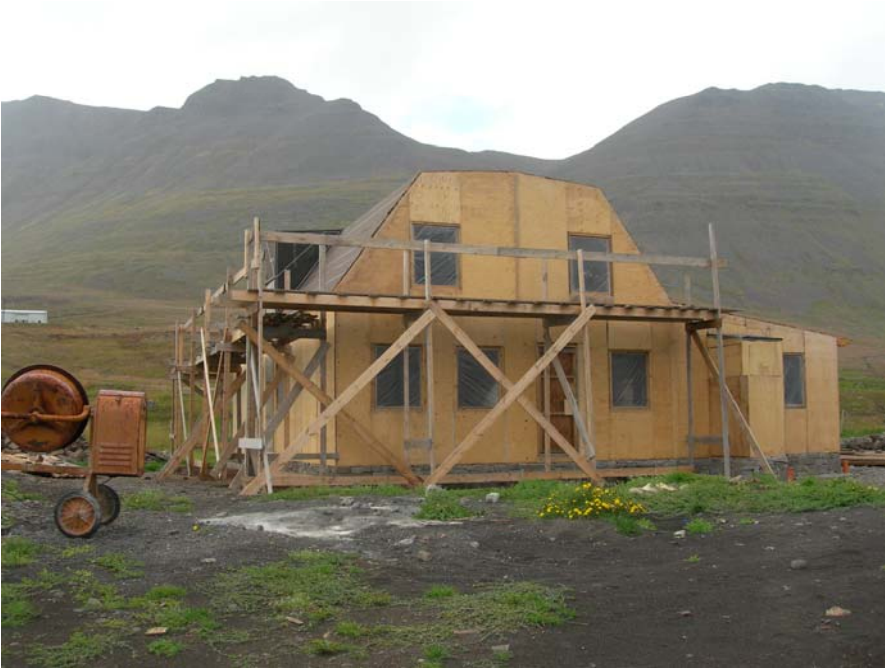
Ljósmynd tekin í ágúst 2007, Þórir Sigurhansson